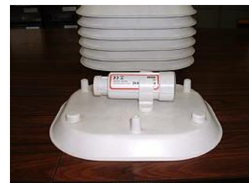
ホボプロ V2 取付写真 付属取付ブラケットで シェルターの天井に取付