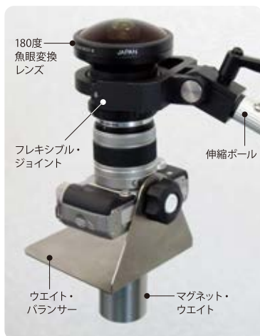
180度 魚眼変換 レンズ フレキシブル・ ジョイント 伸縮ポール ウエイト・ バランス マグネット・ ウエイト